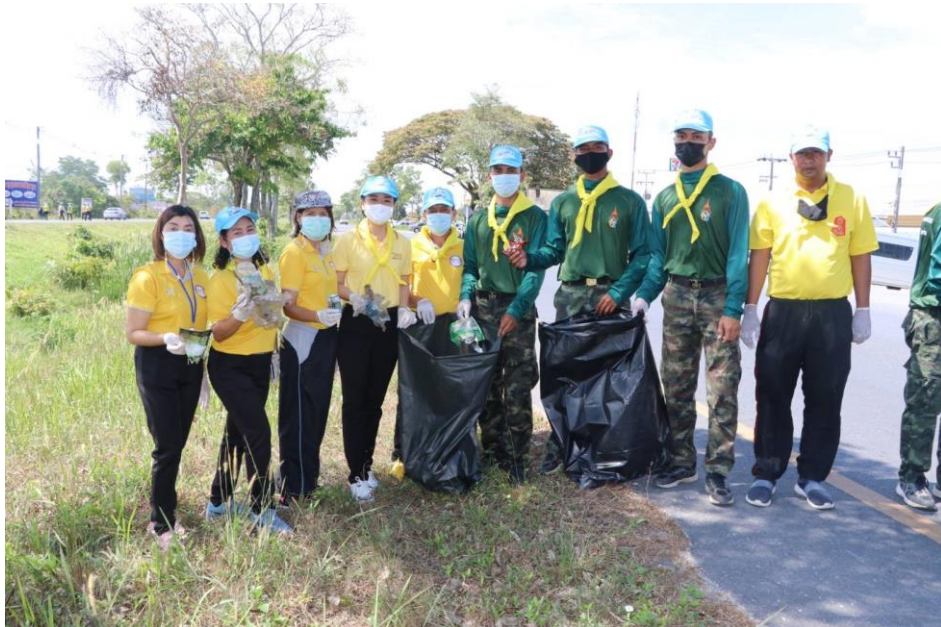
ร่วมกิจกรรมจิตอาสา กับส่วนราชการ หน่วยงาน รัฐวิสาหกิจ องค์กรเอกชน ภาคประชาชน ทำความสะอาดบริเวณถนนและรางรถไฟ อ.ทุ่งสง