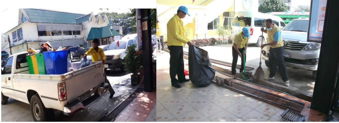
➤ บุคลากร สพ.นครศรีธรรมราช ร่วมกิจกรรมจิตอาสา กับส่วนราชการต่าง ๆ เพื่อทำความสะอาดสถานที่สาธารณะ เช่น ตลาด บริเวณถนน รางรถไฟ และอื่น ๆ